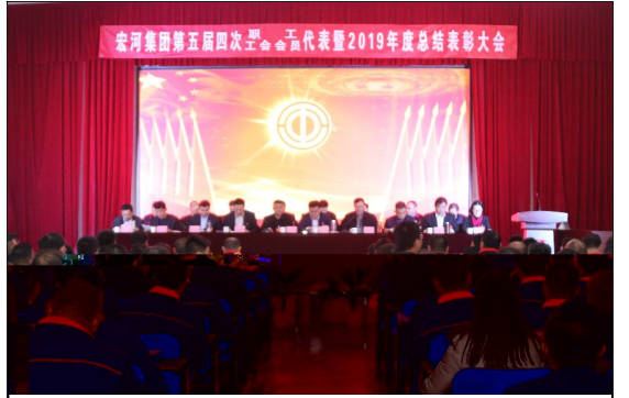
1 a 19日, 宏河集团第五届四次职代会(工代会)暨2019年度总结表彰大会在横河煤矿职工bc召开。 $TUV W)

2020 * 2 + 11, 山东宏河控股集团有限公司 主办 $%&' ( ) 8 9: ; - . / O1 * 2 + 34 67578&9: ; < $O; < ) = 2019 * > ? @ABC<DE